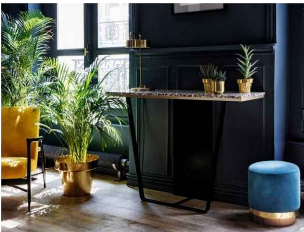
Console Terrazzo large, 1.490 €

Pour l'intégrer chez moi, je... le décline dans sa version la plus discrète : sur un meuble. Ici, la console habillée de terrazzo vient enrichir un intérieur façon Art déco.