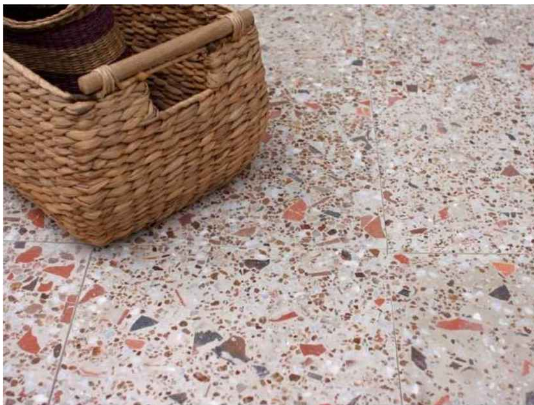
Terrazzo Tsari coloris terracotta

Le terrazzo, matériau composite très ancien, revient en puissance, aussi bien dans sa forme d'origine, qu'en tant que motif graphique inspirant les créateurs. Zoom et conseils pour adopter cette tendance au fort caractère.